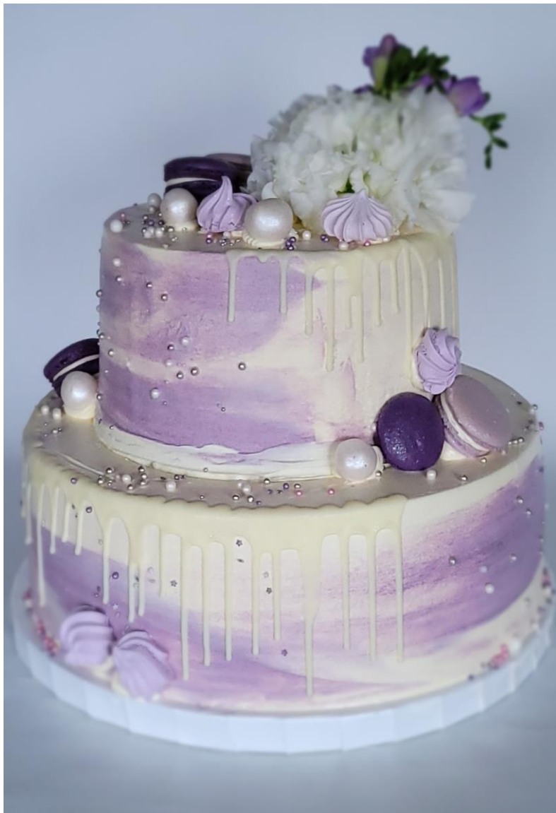
OK1/Z2 Tort okolicznościowy, różne warianty kolorystyczne