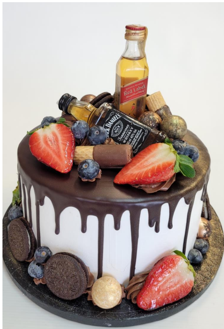
OK1/J Tort z buteleczkami