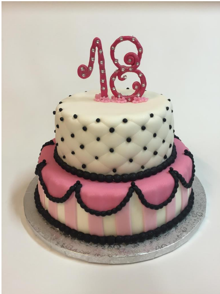
OK31 Tort 2 piętrowy, dekoracja w masie cukrowej, smak dowolny