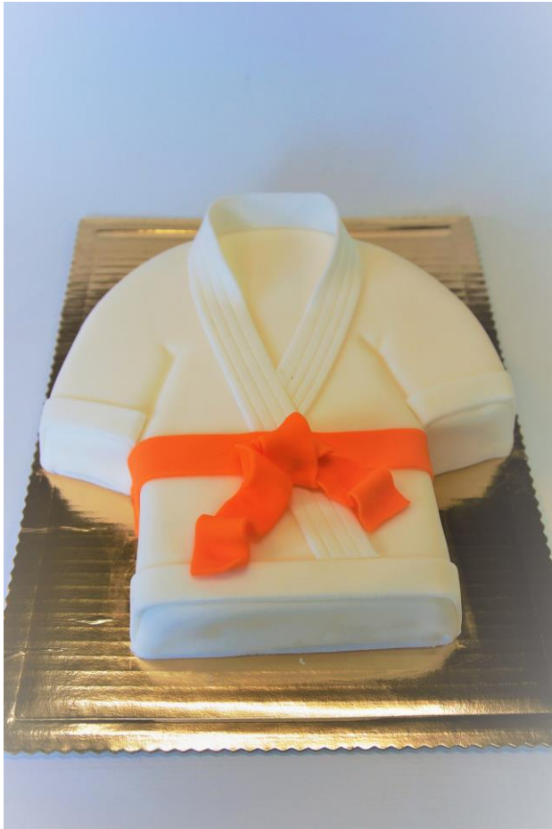
OK37 Tort kimono, dekoracja w masie cukrowej, smak dowolny