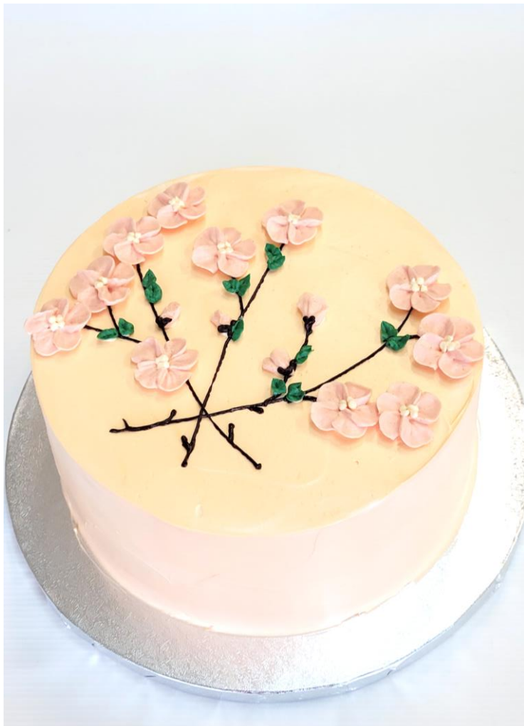
OK1/L Tort z kwiatuśzkami maślanymi