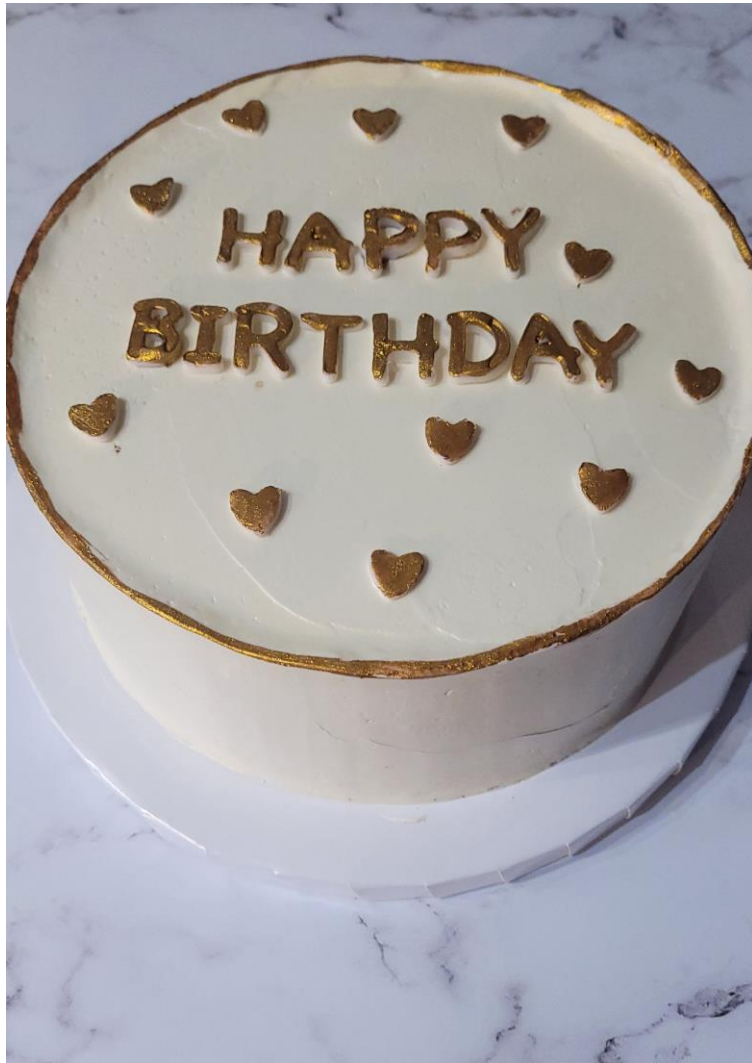
OK1/Z4 Tort Happy Birthday