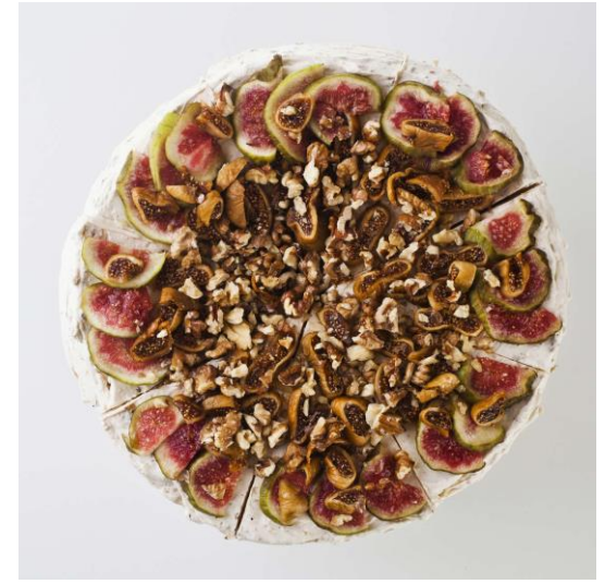
ST1 tort beza pavlova z bakaliami