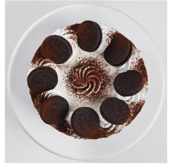
ST7 tort rodeo