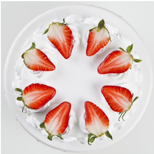
ST16 tort śmietankowo-truskawkowy