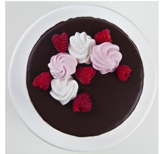
ST15 tort śmietankowo-malinowy