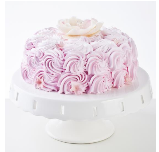
ST17 tort śmietankowo-wiśniowy