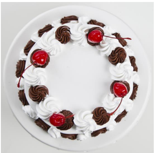
ST14 tort szwarcwaldzki