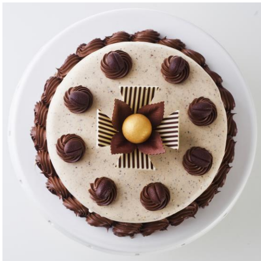
ST22 tort orzechowo- kawowy