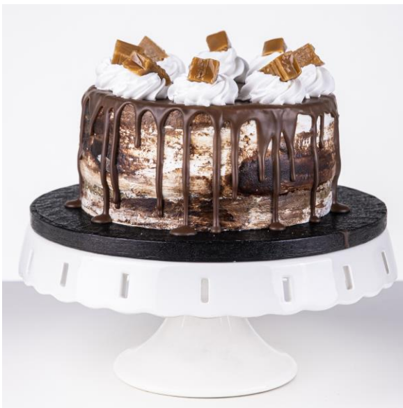
ST28 tort słone toffe