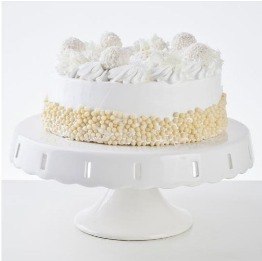
ST8 tort rafaello