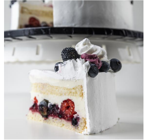
ST26 tort śmietankowy- owoce leśne