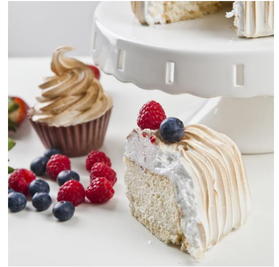
ST3 torcik nicea