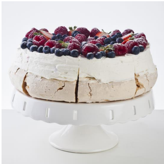
ST2 tort beza pavlova z owocami