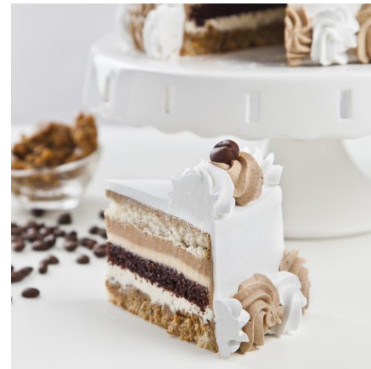
ST13 tort cappuccino