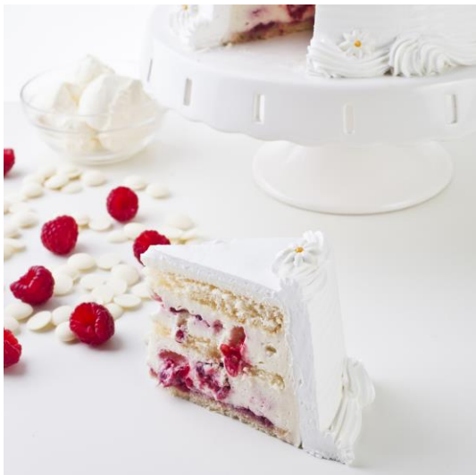
ST11 tort biała czekolada