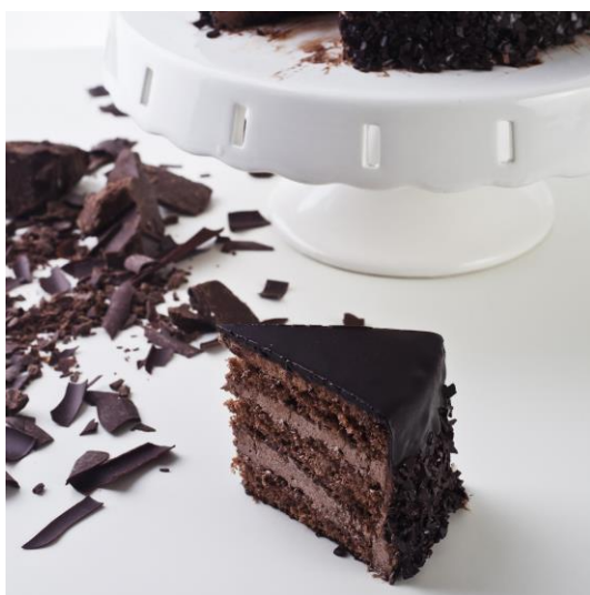
ST20 tort czekoladowy