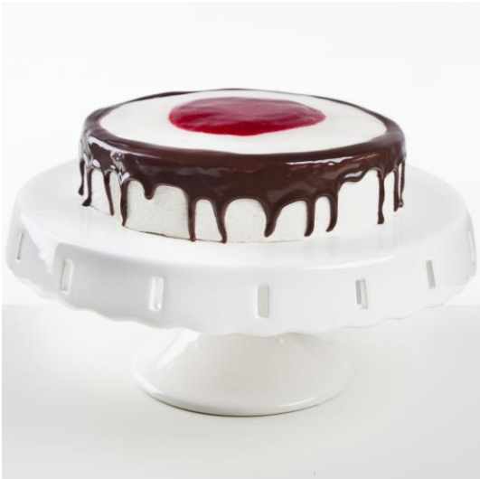
ST4 torcik sernikowy