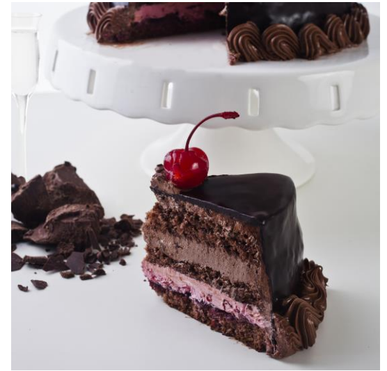
ST23 tort czekoladowo- wiśniowy