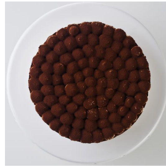
ST9 tort tiramisu