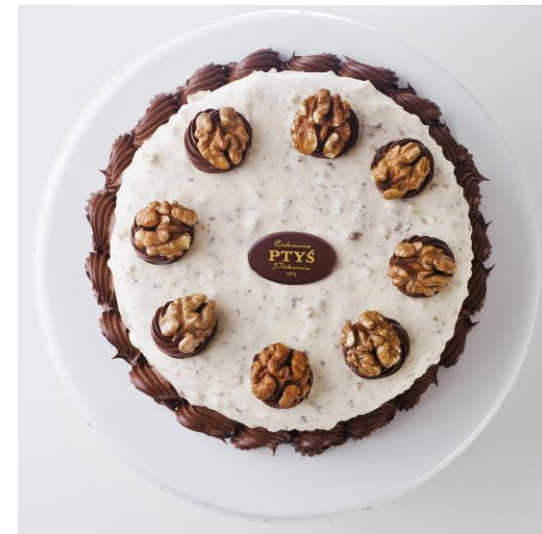
ST21 tort orzechowo-czekoladowy