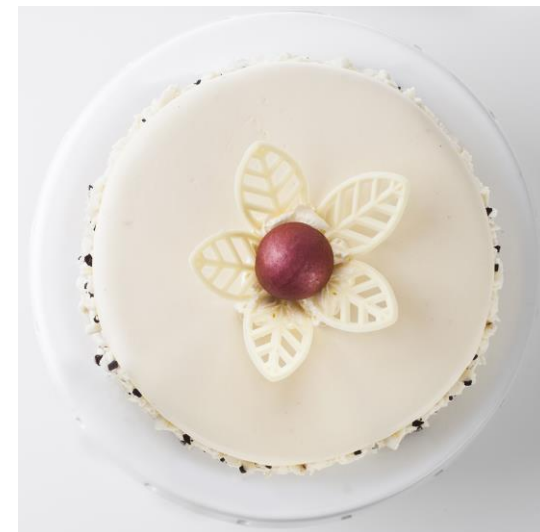
ST19 tort czekoladowo-adwokatowy