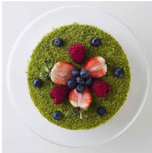
ST6 torcik leśne runo