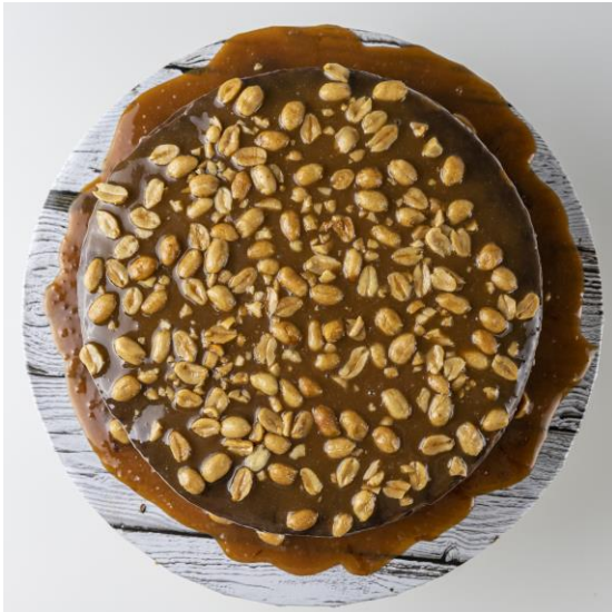
ST27 tort słony karmel