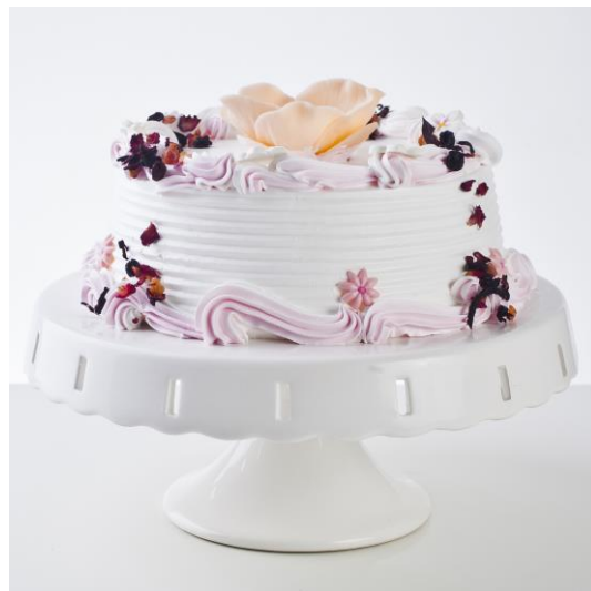
ST10 tort mascarpone