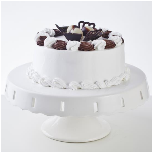
ST18 tort śmietankowo-czekoladowy