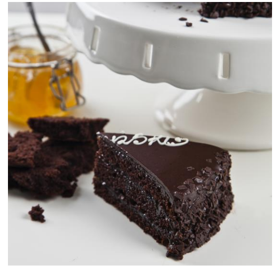
ST5 torcik wiedeński